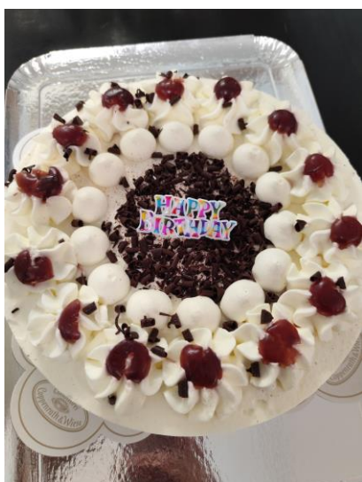
Anniversaires du mois